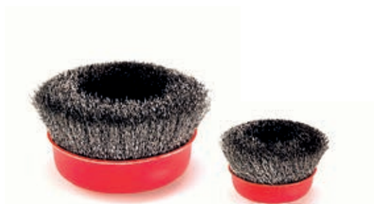
ASF100100 / 100200 Koppbørste metall

Kantsliping: Bruk i kombinasjon med rondeller i Bona Abrasives-serien.