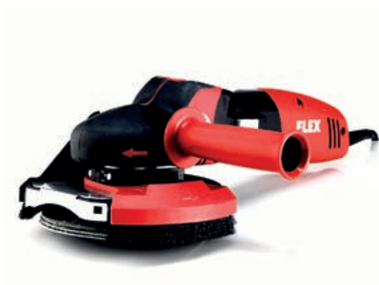
AMF 100000 Bona SUPRAFLEX

Kraftig 1400 W slipemaskin for kantbørsting og sliping av tregulv. Kant børsting: Bruk i kombinasjon med metall og nylon koppbørste.