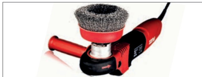
Kraftfulle prestasjoner helt ut til veggen

Bona SupraFlex er den ideelle følgesvenn og støtter alle funksjoner på Bona Power Drive NEB. Med bruksområder fra finsliping til grovere sliping og børsting for kreative effekter, gir det ypperlige verktøyet unike 2-dimensjonale farger og børstede effekter helt ut til kanten.