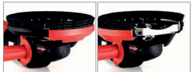
Moveable head with quick snap makes it easy to get close to walls and hard-to-reach areas.

Med sin kraftige 1400W-motor har Bona SupraFlex trinnløst hastighetsvalg for enkel hastighetsjustering, samt redusert støy. Den lave høyden gjør det mulig å nå vanskelige områder, mens M14-verktøyets armatur gjør det enkelt å bytte fra slipeputer til børsting med nye Bona Cup-børster, med en enkel vri