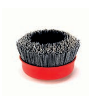
ASF 100300 Koppbørste nylon

Metallkantbørste for børsting av tregulv: Tilgjengelig i 80 og 120 mm diameter størrelse